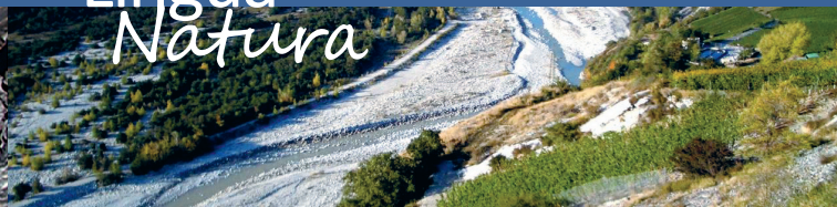
Parc naturel Pfyng-Finges