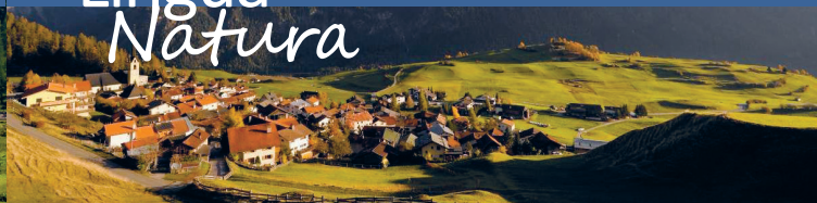
Parc natiral Ela