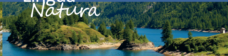
Parco naturale Veglia Devero