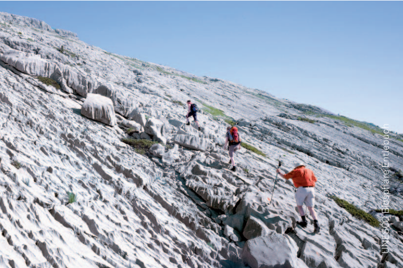
Ulysses | Espinasse Entlebuch

Dans le Parc National Suisse, la nature est primordiale. Les plantes et les animaux s'épanouissent librement, le développement des milieux naturels suit son propre cours. L'homme est observateur et profite d'un réseau de 80 kilomètres de chemins pédestres, de sentiers didactiques sur le thème de la nature et d'excursions en famille.