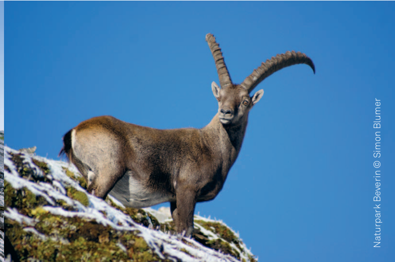
Naturpark Beverin