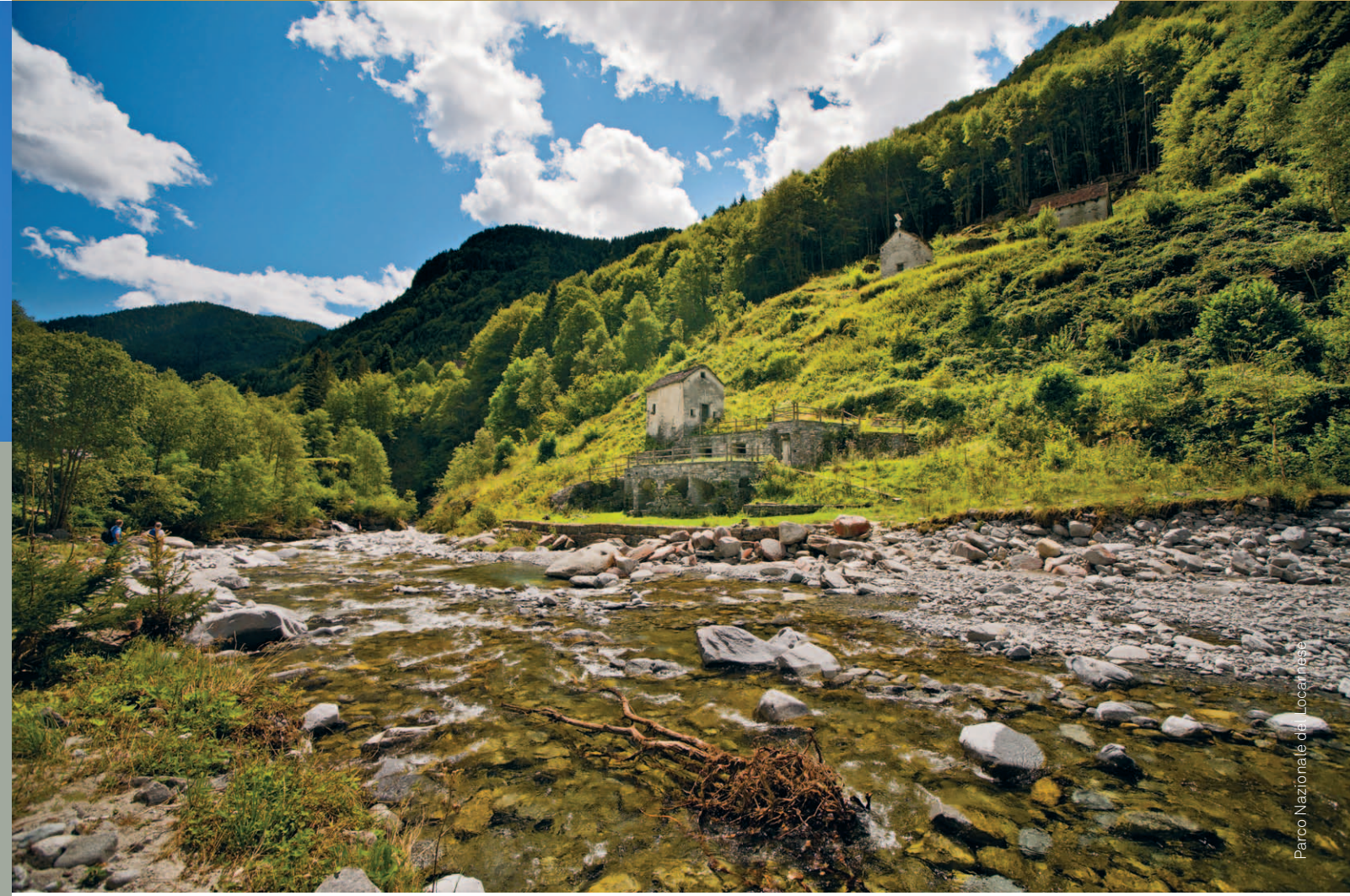
Parco Nazionale del Locarnese

15.54 % de la surface de la Suisse 257 communes font partie des parcs