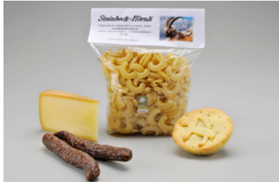
NPB14T02 CHF 25.90