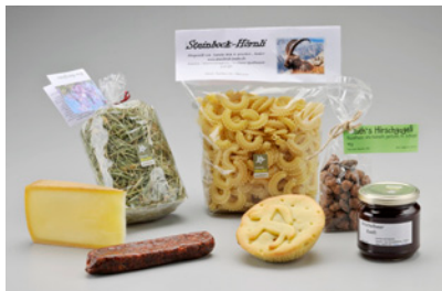
NPB14T03 CHF 45.-