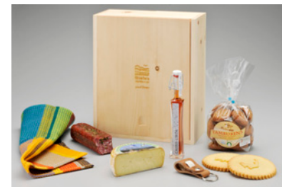
BVM14T03 CHF 98.-