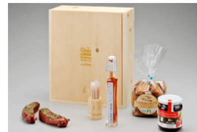
BVM14T02 CHF 69.-