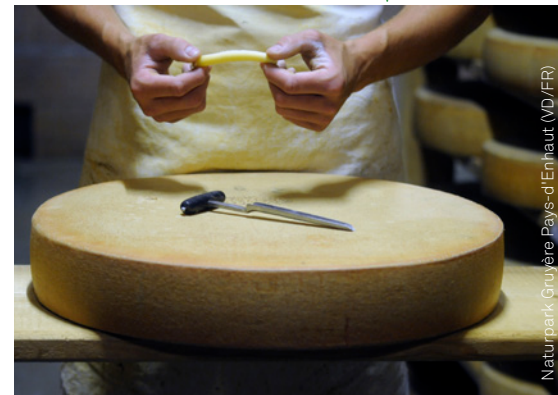
Naturpark Gruyère Pays-d'Enhaut (VD/FR)