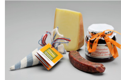
BVM13T01 CHF 19.-