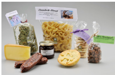
NPB14T04 CHF 57.90