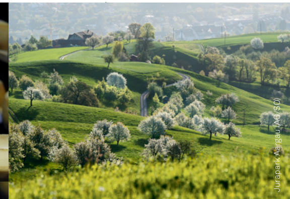
Jurapark Aargau (AG/SO)