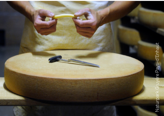
Naturpark Gruyère Pays-d'Enhaut

Herausragende Produkte, welche die Anforderungen der Regionalmarken erfüllen, nachhaltig produziert werden und die regionale Wirtschaft stärken, können vom Bund zertifiziert und mit dem Produktlabel «Schweizer Pärke» ausgezeichnet werden. Die in diesem Katalog enthaltenen gelabelten Produkte sind mit dem grünen Logo «Schweizer Pärke» gekennzeichnet.