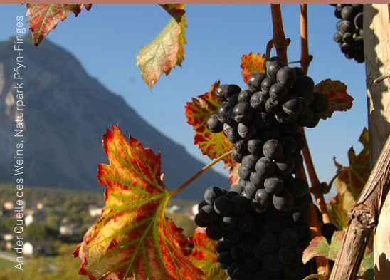
An der Quelle des Weins, Naturpark Pfyn-Finges

Naturpark Chasseral • Tel. +41 (0)32 942 39 49 info@parchasseral.ch