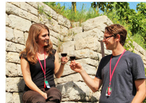
Weinwanderung im Jurapark Aargau