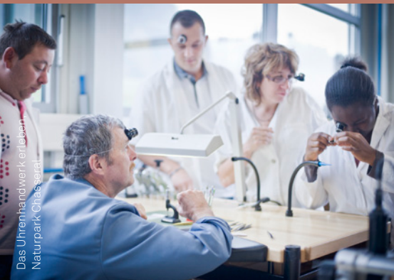
Das Uhrenhandwerk erleben im Naturpark Chasseral

Neben den hier aufgeführten Vorschlägen finden Sie weitere Angebote auf www.paerke.ch unter der Rubrik Pärke entdecken > Gruppen/Firmen.