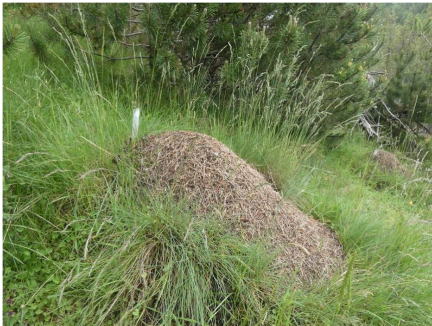
Une des plus belle fourmilière de la colonie, âgée d'une trentaine d'années.

Parallèlement au recensement des fourmilières, tous les nids ont à nouveau été photographiés ainsi que la canopée au-dessus d'eux, pour suivre l'évolution de la végétation autour des nids et la fermeture ou la fermeture de la canopée en fonction de la croissance des arbres ou de leur chute.